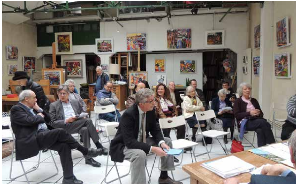
L'assemblée vue de face.

J'espère que les changements dans les statuts augurent d'un début de commencement d'une