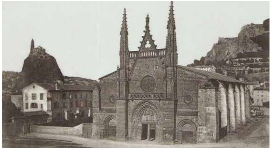
L'église Saint-Laurent-du-Puy où fut fusillé le marquis de Surville le 18 octobre 1798.

Surville fut de retour en août 1797, ayant reçu des mains de Louis XVIII, le 8 mars précédent, le ruban de l'ordre royal de Saint Louis. Il voulut effrayer les républicains et frapper l'imagination populaire : le 30 septembre 1797, Dominique Allier et lui s'empara-