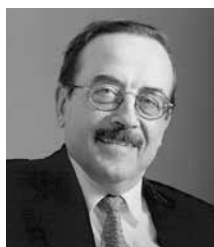
Pierre de Lauzun