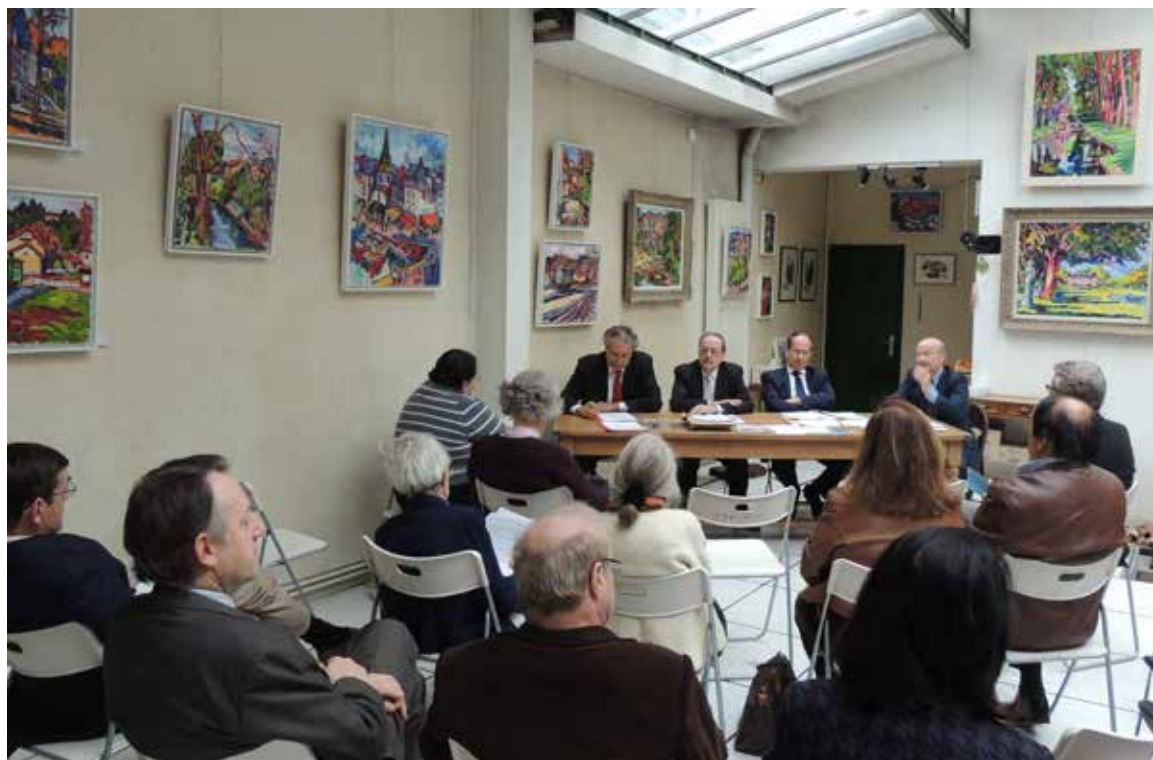
L'assemblée vue de dos.

réflexion sur la façon dont notre objet social est servi, puisqu'il a été reconduit et complété, ainsi que sur le pilotage à moyen terme nécessaire aux évolutions significatives.